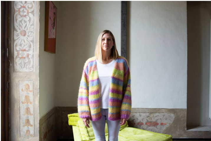
CARDIGAN A RIGHE