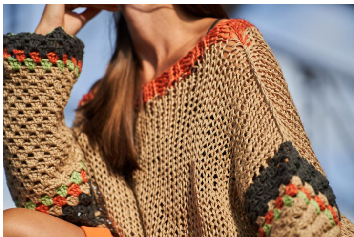
Schema: inizio della manica (lavorazione granny)